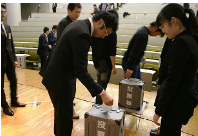
審査員と一般の方との投票 で結果が出ました