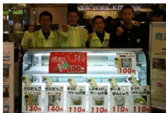
エスパル山台店での販売実習は大盛況でした（12月）