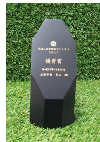
副賞として、「雄勝石」製の トロフィーが授与されました