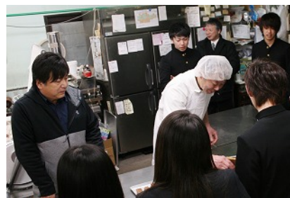
今回の工場見学の様子

商 業科目「課題研究」の商品開発講座で開発を進め、商品化が実現した『イシノマキマン感動いっパイ』。これまで、地元企業のご協力をいただいて完成までたどり着くことができました。パッケージデザインなどについて、webデザインや広告を取扱う「ビヨンド」様、製造については「洋菓子カルン」様と連携してきました。2月9日（金）には、「洋菓子カルン」様の工場を訪問させていただき、菓子が完成するまでの工程を見学しました。今回、工場を見学することで、商品の企画から製造、販売までの一連の過程を学ぶことができ、生徒には有意義な一日になりました。