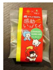
今回商品化が実現した「イシノマキマン感動いっパイ」