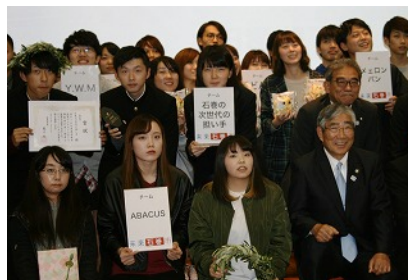
決勝大会には大学生や高校生など、 12チームが参加しました