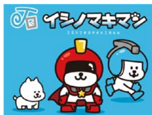
石巻活性のシンボル「イシノマキマン」